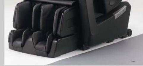
Fauteuil de Massage Inada 3A

Le pelvis est totalement maintenu par des poches d'air, procurant ainsi la sensation d'être dans un berceau.