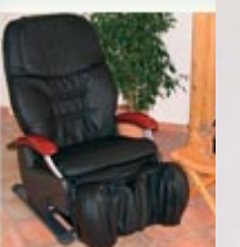
Inada I.1 FM