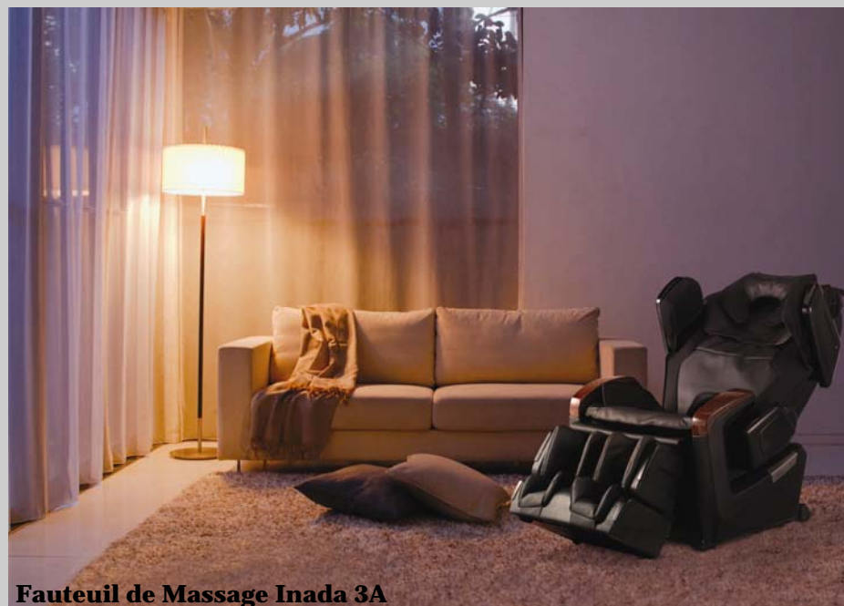
Fauteuil de Massage Inada 3A

Vous pourrez vous apercevoir de son efficacité lorsque vous sentirez les bienfaits du traitement complet des points shiatsu, conformément aux techniques du massage professionnel.