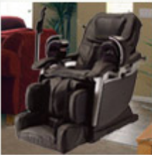
Inada D.5 Robo Massage Chair