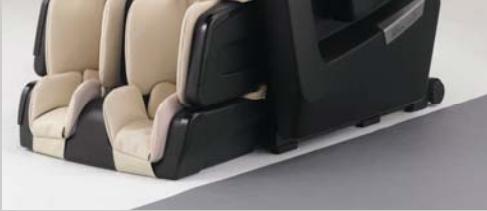
Fauteuil de Massage Inada 3A

Fournit un support total du pelvis lors du massage shiatsu effectué grâce à une technique de massage manuel.