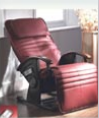
Inada 2000 Massage Cha