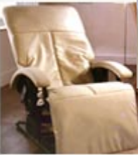
Inada 2007 Massage Chair