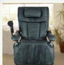
Inada W.1 Massage Chair