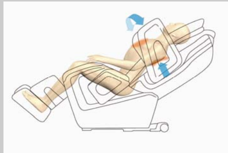
Etirement du torse

Tandis que les poches d'air maintiennent les jambes droites, cette position procure un étirement qui va du mollet à la partie supérieure de la cuisse.