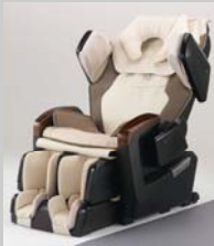
Inada 3A Massage Chair