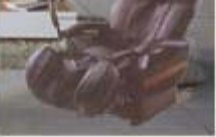
Inada I.1 FED Massage Chair