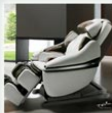
Inada Sogno DreamWave Massage Chair