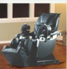
Inada D.1 Massage Cha