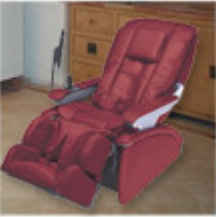
Inada D.6 Robotic Massage Chair