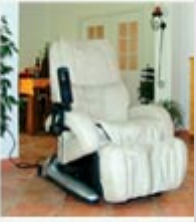
Inada H.9 Massage Cha